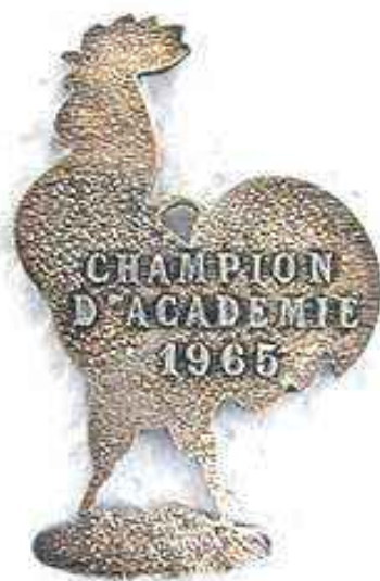
1965 : champions d'Académie