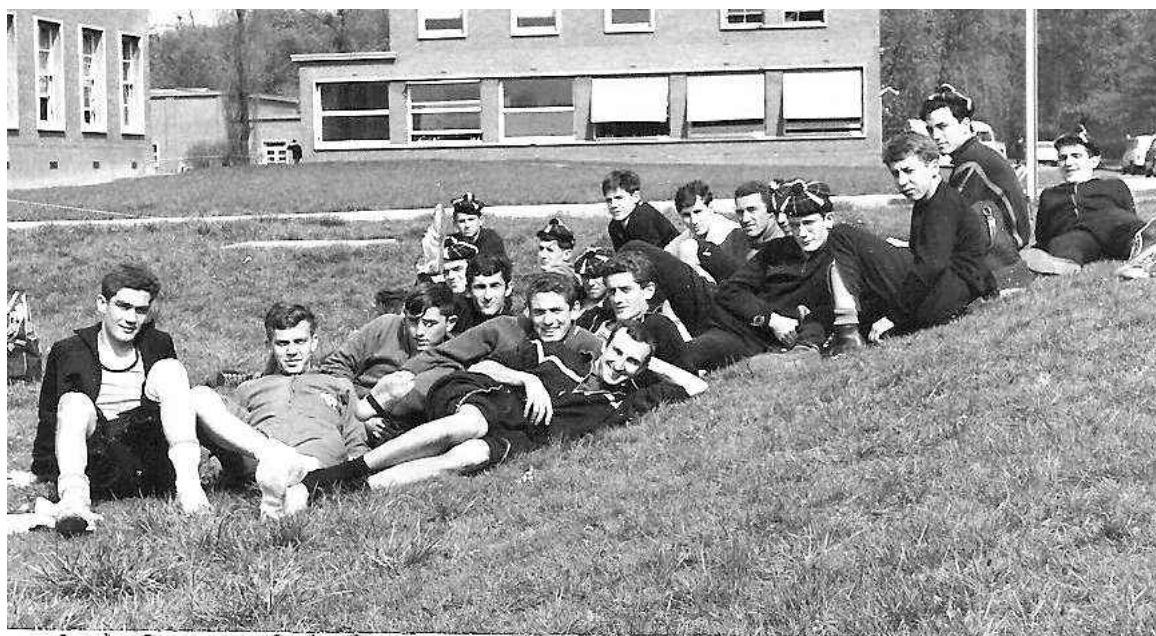
INS PARIS (1961-1965)