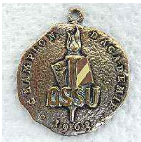
1963 : champions d'Académie