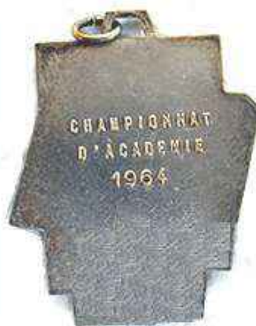
1964 : champions d'Académie